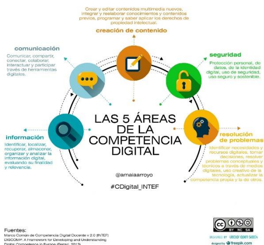
Figura 1. Infografía de las 5 áreas de la Competencia Digital (INTEF, 2017).

Fonamentació de la CD: Segons el Marc Comú de CD docent (MCCDD) existeixen 5 àrees de CD que tot docent ha d'adquirir per a poder incorporar en els seus processos d'ensenyament - aprenentatge.