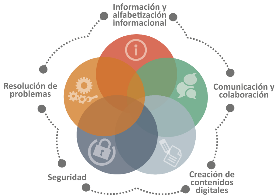
Figura 2. DIGCOMP v2.2. Marco de la Competencia Digital para la Ciudadanía (2022).

En aquesta taula apareix el detall de les 5 àrees competencials i les 21 competències associades, que és el marc que utilitzem des d’NCA per poder determinar el grau d’adquisició de la competència digital dels nostres estudiants.